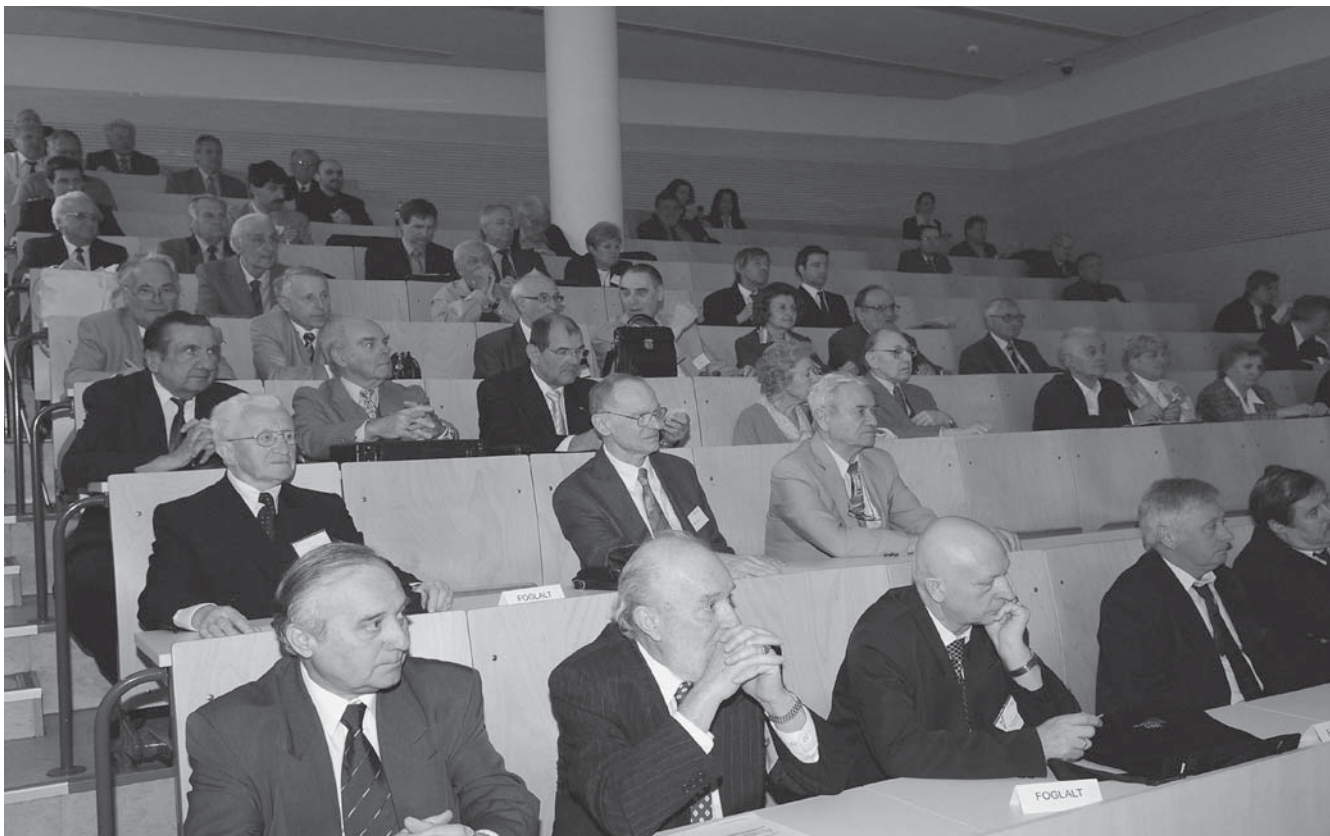
A GTE XL. Küldöttközgyűlés résztvevői