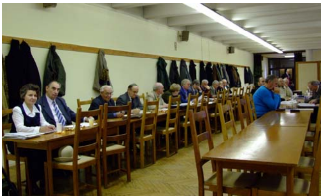
Az OTT résztvevői

A felvetett kérdések mindegyike racionális, Egyesületünk jövőbeni tevékenységét alapjaiban érinti, azokra adott válaszok hosszú távra meghatározhatják és befolyásolhatják Titkári Karunk cselekvési stratégiáját.