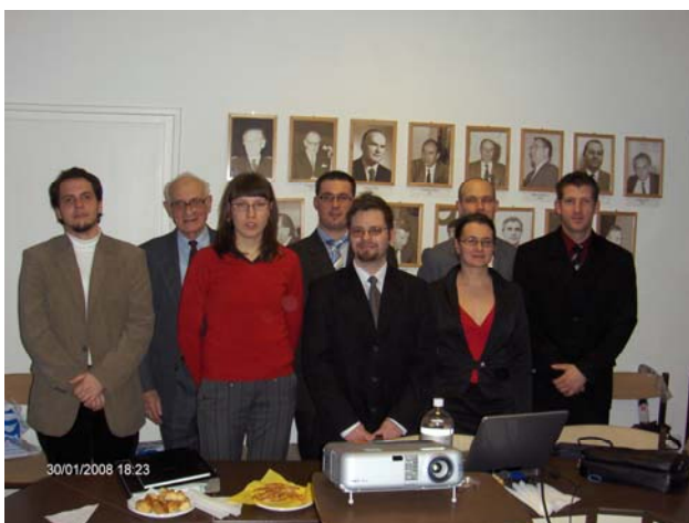
A pályázat résztvevői

A 2008. január 30.-án megtartott előadói ülésen mintegy 25 fő jelenlétében az első három helyezett ismertette munkájának eredményeit. Mindhárman tématerületüket uralva, a megoldandó problémákat kiemelve, lendületesen és érdekesen fejtették ki mondanivalójukat, igazi szakmai élményt nyújtva a hallgatóságnak. Az előadók pénzzutalomban, a többiek dicséretben részesültek, a pályázat összes résztvevője műanyag tárgyú könyvet és szakmai emléket kapott ajándékba.